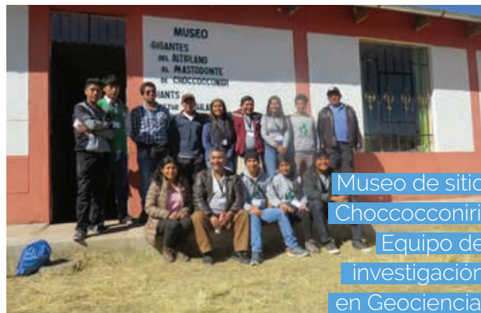
Museo de sitio Choccoconiri. Equipo de investigación en Geociencia.