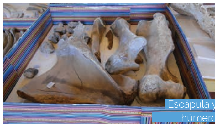
Escápula y húmero