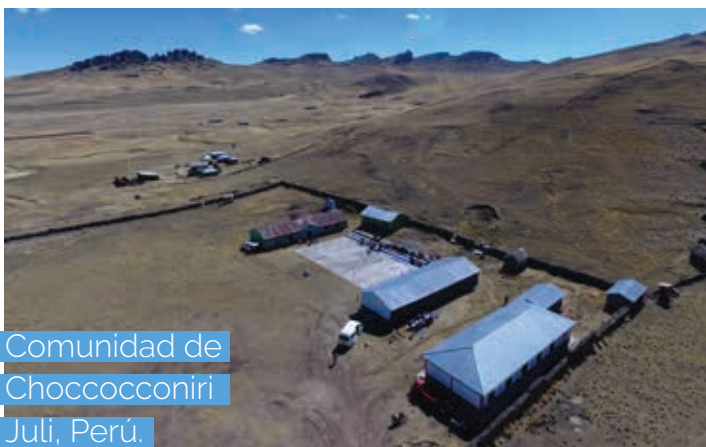
Comunidad de Choccoconiri Juli, Perú.

En julio, el equipo de Geociencia realizó un trabajo de mapeo, descripción y valoración de geositos, paleofauna y microclimas para una propuesta de geoparque en Choccoconiri en Juli, Puno.