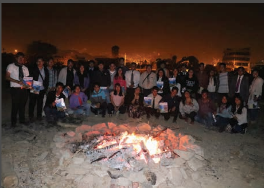
Programa recepción de sábado "Celebrando la Creación – los cielos cuentan la Gloria de Dios".

El sábado 28 de octubre la iglesia adventista celebró en todo el mundo el Sábado de la Creación por medio de numerosas iniciativas promovidas por iglesias locales, uniones, divisiones e instituciones. En la UPeU, el Centro de Recursos en Geociencia organizó un completo programa de dos días titulado "Celebrando la Creación. Proclamando el mensaje del primer ángel". El programa se inició el viernes con una velada de cantos, oración intercesora y meditación al aire libre con el tema "Los cielos cuentan la gloria de Dios", en la que los asistentes tuvieron también la oportunidad de compartir la sabrosa "torta de la Tierra".